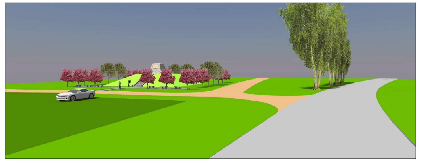
Skatu atvērums no autoceļa Garoza - Jelgava uz vareļu piemīņas vietu. Skats pārējā veģetācijas periodā.