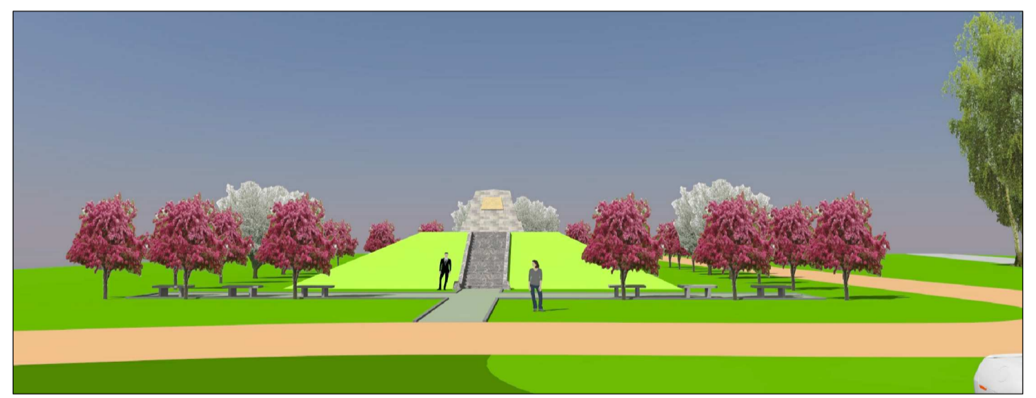
Skatu atvērums no autostāvvietas uz Vareļu piemīņas vietu. Skats maijā, jūnijā.